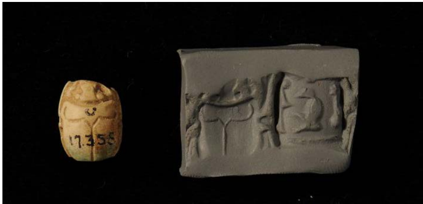
Печать-штам из нововав. Ура (печать-скарабей). U 17355.